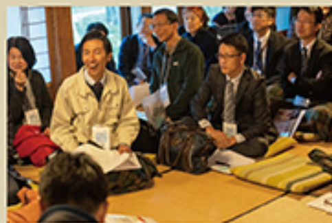
・第2分科会「外国人を招いてんやかんやの観光推進協議会」のようす